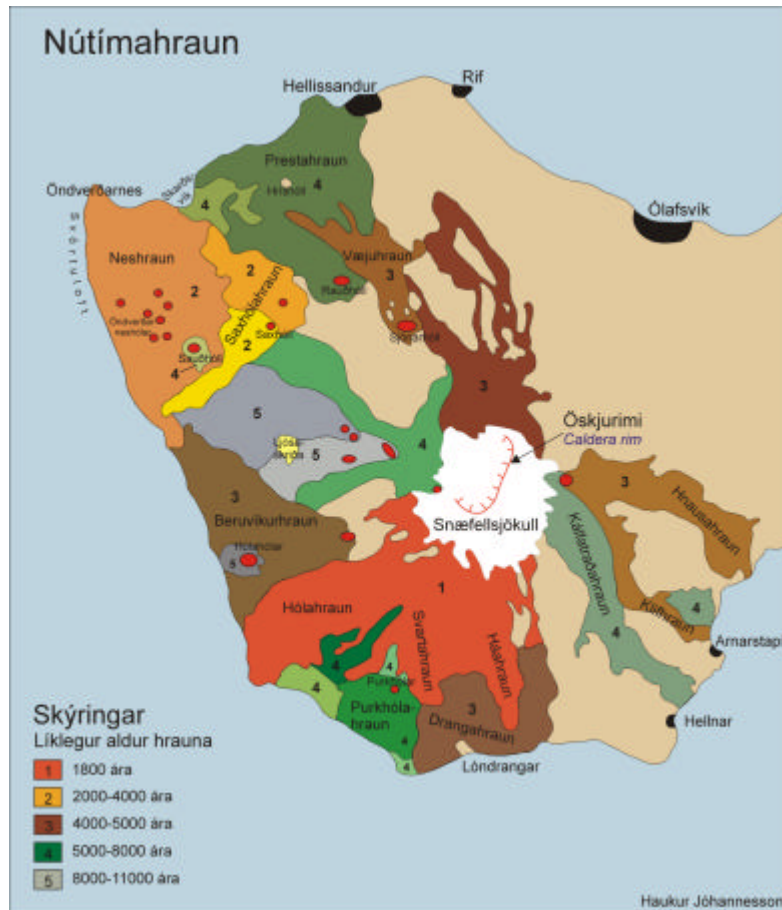
Mynd 4. Hraun í Þjóðgarðinum Snæfellsjökli, kortagerð Margrét Valdimarsdóttir.

Undir eldkeilum eru kvikuþrær. Algengasta gerð eldfjalla erlendis eru eldkeilur og má þar nefna Vesúvius og Etnu. Hér á Íslandi eru fjórar eldkeilur og eru það: Snæfellsjökull, Eyjafjallajökull, Tindfjallajökull og Örfajökull. Síðast gaus í Snæfellsjökli fyrir um 2000 árum. 26