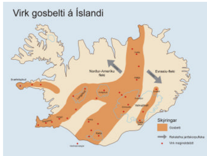
Mynd 2. Virkt gosbelti á Íslandi, kortagerð Margrét Valdimarsdóttir.

Á Snæfellsnesi er afar fjölbreytt jarðfræði og þar má sjá jarðmyndanir frá nær öllum tímabilum jarðsögu Íslands en Snæfellsnes er virkt gossvæði og liggur fyrir utan gosbeltið sem liggur þvert í gegnum Ísland.