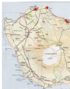
Mynd 1. Gula línan sýnir hvar mörk þjóðgarðsins liggja

Þjóðgarðurinn er staðsettur vestast á Snæfellsnesi og er það svæði oft nefnt "undir Jökli" 13 og er það tilvísun í nálægð hins dulmagnaða Snæfellsjökuls. Mörk þjóðgarðsins liggja um austurjaðar Háahrauns að sunnan í landi Dagverðarár og að norðan á austurmörkum Gufuskálalands.